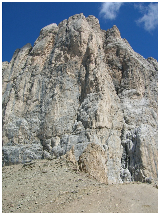
Marmolada - Punta Penia (aus Wikipedia): Über den linken Pfeiler führt die Route von Maffei/Frizzera, durch die zentrale Zone die Via Soldà und rechts über den Südpfeiler die Via Micheluzzi - drei berühmte, klassische und ästhetische Routen