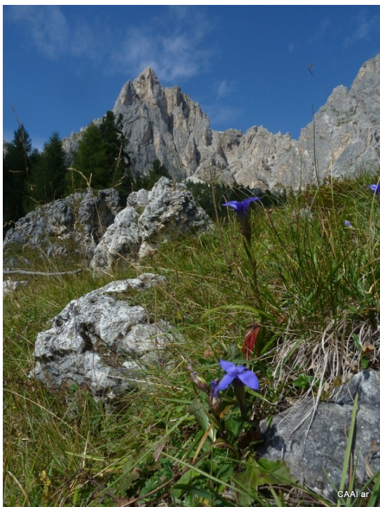
Eine hohe Ethik ist immer mit dem Begriff der Schönheit in Verbindung

Es wäre eine sehr schöne Erfahrung, wenn Verwandte oder Nicht-Teilnehmer, die im Tal oder nahe dem Wandfuß warten, durch ihre wahrnehmende Fähigkeit den Akteuren in der Wand eine intensive Sicherheit bieten könnten. Sie verfolgen die Linie, achten auf die Wetterwechsel, zittern bei Steinschlag und sind um eine gute Rückkehr der Kletterer besorgt. Die menschliche Solidarität, in einer aktiven, wahrnehmenden und unterstützenden Gegenseitigkeit, eröffnet größere Dimensionen gegenüber mancher isoliert angewendeten Technik. Die Ethik der Solidarität, der Selbstwahrnehmung und des Selbstrespekts eröffnet große Dimensionen und wäre eine in der Zukunft zu entwickelnde Dimension. Diese Ethik könnte nicht nur zur Solidarität beitragen, sondern zu einem gegenseitigen Schutz vor Gefahren werden. Es ist nicht nur das Seil, dass das Risiko verringert, sondern der „Schutzpatron“, also die kreative Ethik, die auf die Ermutigung des Gefährten ausgerichtet ist und die größte und noch nicht entdeckte Dimension der Sicherheit bietet.