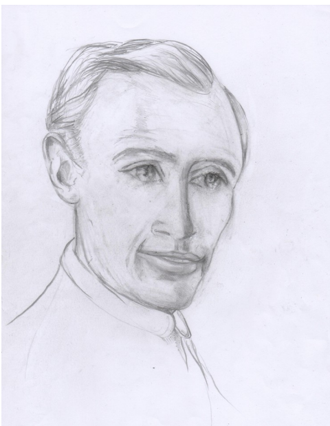
Paul Preuss

Es war Paul Preuss, der um 1912 die Regeln des Bergsteigens definierte. Seine Maxime war das Freiklettern ohne künstliche Hilfsmittel. Das Seil durfte nur ein erleichterndes und kein unentbehrliches Mittel sein und der Bergsteiger musste seinem Unternehmen nicht nur gewachsen, sondern überlegen sein. (3)