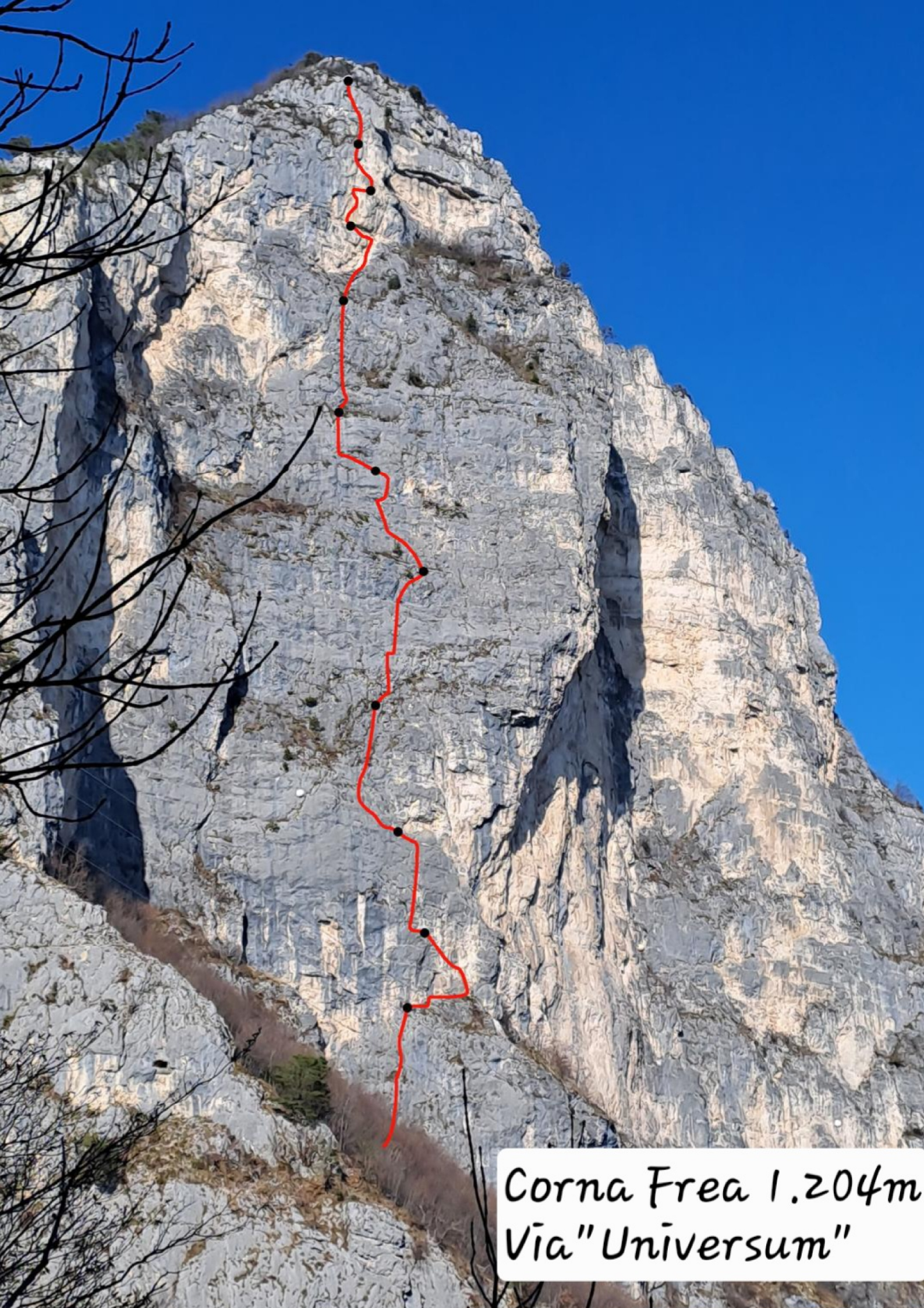
Corna Frea 1.204m Via "Universum"